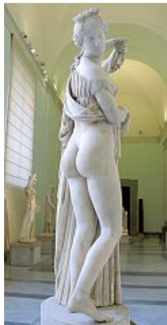
San Martino Il chioistro