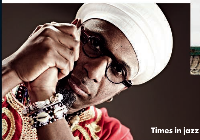
Times in jazz