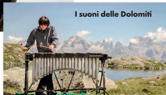
I suoni delle Dolomiti