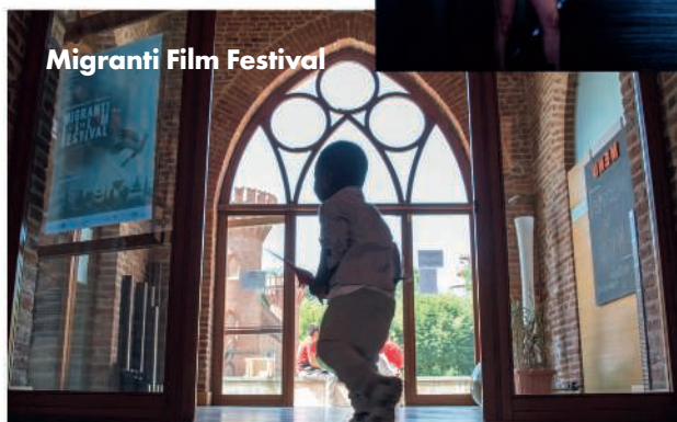
Migranti Film Festival