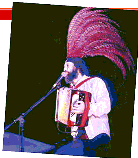
Alcuni momenti del concerto