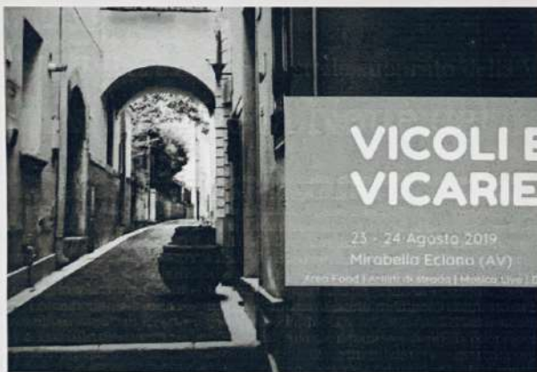
La locandina dell'evento

E' festa a Mirabella nel segno di "Vicoli e vicarielli"