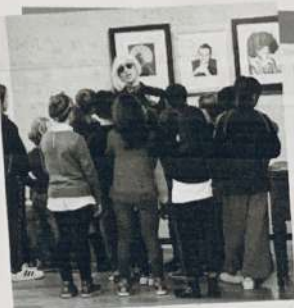
L'atelier d'arte per i piccoli

Una raccolta di dodici brani, nove dei quali cantati in duetto con Fiorella Mannoia, Serena Autieri, Luca Carboni, Federico Zampaglione, Massimo Ranieri, Paola Turci, Gigi D'Alessio e Alice. E' lo stesso Ron a sottolineare in numerose interviste l'emozione del tour: "ogni volta che le cantavo era come scoprire un mondo e al tempo stesso non c'era bisogno che già le conoscessi. Ho uno stupore continuo ogni sera che le canto, è come riscoprire una seconda volta cose che ho sempre conosciuto".