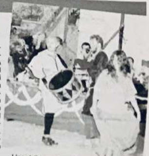
Una delle scorse edizioni della festa

Torna alla sua ventiquattresima edizione l'appuntamento con Medioevo alla Rocca in programma da domani a domenica 25 agosto. A rivivere nel borgo all'ipino le suggestioni del Medio Evo, dallo spettacolo del fuoco ai musicisti itineranti, dal processo alla strega ai musicisti itineranti, dal processo alla strega ai musicisti itineranti, dall'accampamento militare longobardo a giocolieri, fochieri e arcieri, dalla Riuos Band ai Vardanti di Montevergine, dal Circo Sonambulo alla Compagnia dei Baffardelli. Un viaggio tra dame, cavalieri, mercanti, maghi e fattucchiere, capace ogni anno di incantare il pubblico, promossa dalla pro loco Ansanto con la collaborazione del Comune.